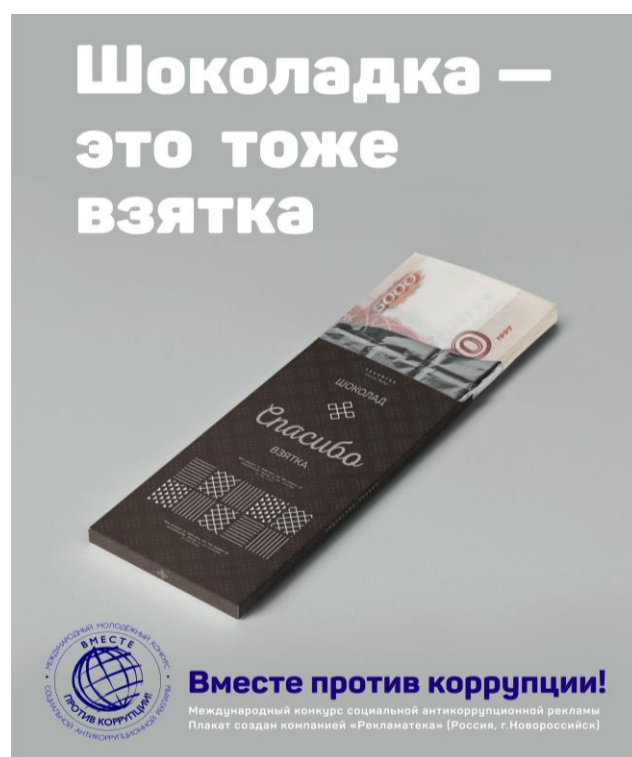
«Шоколадка – это тоже взятка» Автор: Крючков Виктор